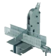
Stříhač žlabu stolní